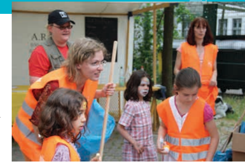
Nachbarschaft: Hoffest in der Lehrter Str. 38-40, Begrünung und Putzaktion der Anwohner

Kultur in der Kulturfabrik: Filmfestival, Freiluftkino, Ferienprogramm für Kufa-Kids, Theaterworkshop Interkulturelles Projekt: „Wir in Moabit ‘mal anders“