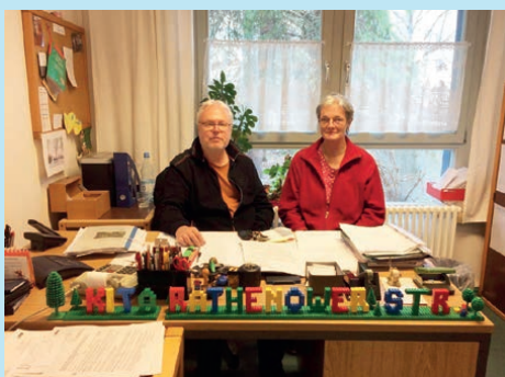
Die Leitung der Kita Rathenower Straße 15